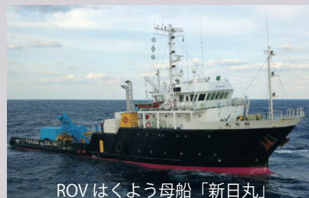
ROV はくよう母船「新日丸」