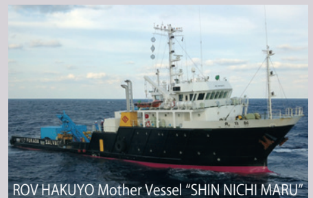
ROV HAKUYO Mother Vessel "SHIN NICHU MARU"